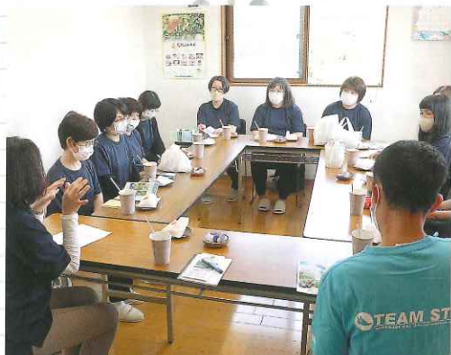
陸前高田市あすなるホームさんにて