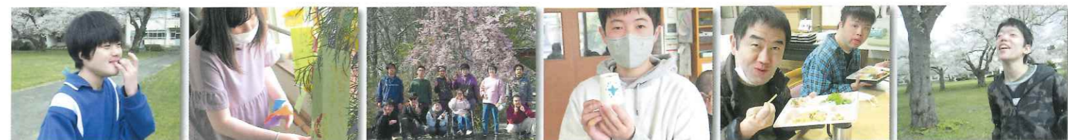
みんなでお花見って楽し～ 願いが叶いますように 桜の木の下で 出来ました 美味しい顔! 満開の桜にウキウキ気分!