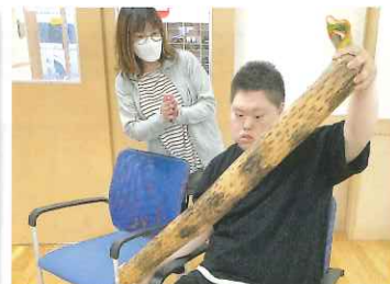
波の音が鳴る珍しい楽器です