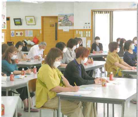
秋田市一羊会さんにて