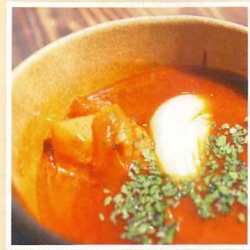
もっちカレー 400円(税込)

自慢の杵つき丸餅をスープチキンカレーで召し上がっていただきます。オールトヨタフェスティバルの出店の際は、「美味しい♡」とリピートして下さる方や、「留守番のお母さんにも食べさせたい」と言って下さるお子様もいて大好評でした。やみつきになる『もっちカレー』は、今後のイベントでも販売予定です！見かけた際は是非一度ご賞味ください。