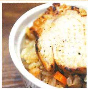
炙り鶏チャーシューおこわ