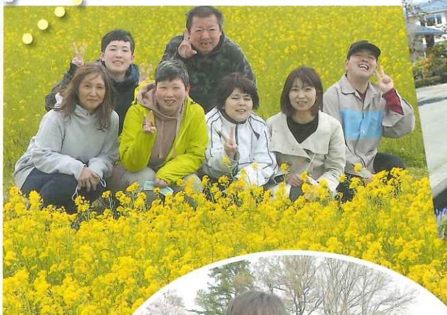
菜の花も笑顔もステキ♡