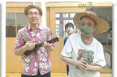
麦わら帽子がベアですね！