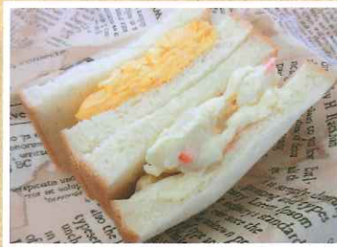
サンドウィッチ（たまご、ポテサラ）