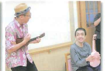
ウクレレ体験！楽しい！