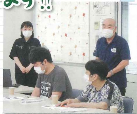
白梅の園さんにて