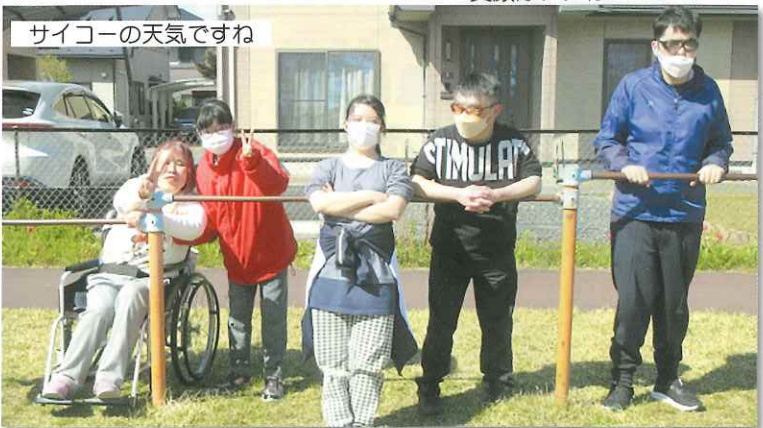
サイコーの天気ですね