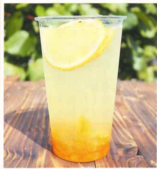
柚子ハニーれもん