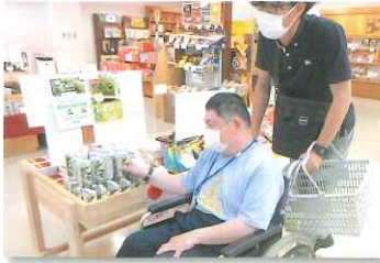
お土産にどうかな？

家族へのお土産を購入したり、コーヒーを飲んだり、皆さん楽しい時間を満喫できたようです。