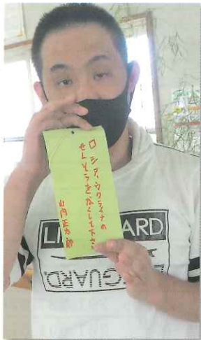
七夕の願い事です