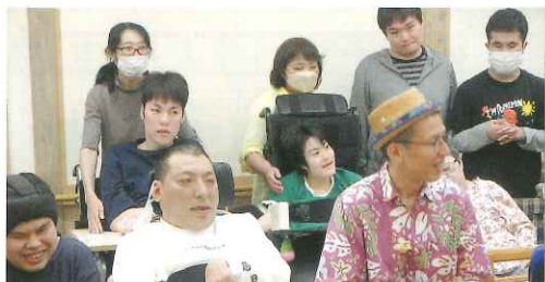
ツジヤマさんと記念撮影