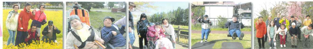
お花に囲まれて お散歩大好き お散歩日和♪ プランコ楽しい♪ みんなでアイーン