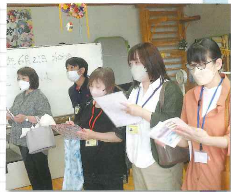
宮古市ゆにぞんさんにて