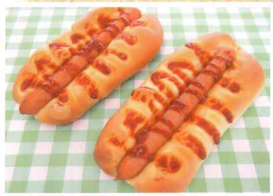
絶品フランクロール