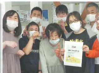
賞状もらいました