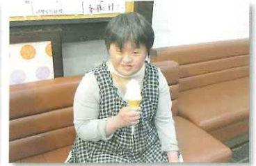
ソフトクリーム大好き♡